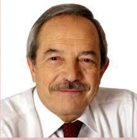
Wenceslao López Martínez Alcalde de Oviedo