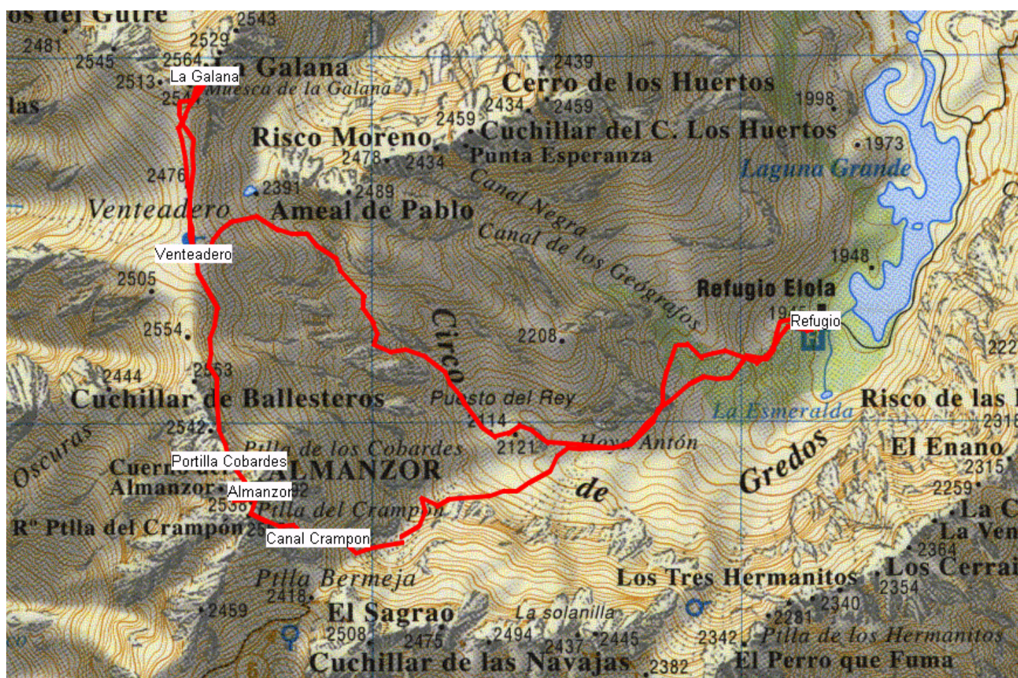
Itinerario marcado sobre un recorte del Mapa topográfico-excursionista de Gredos 1:25.000 de Adrados