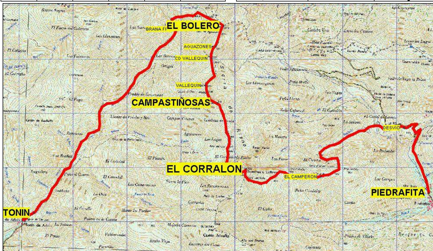
Itinerario marcado sobre un recorte de Mapa 1:25.000 del IGN