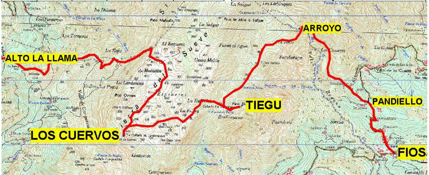
Itinerario marcado sobre un recorte del mapa IGN 0077-1 1:25.000