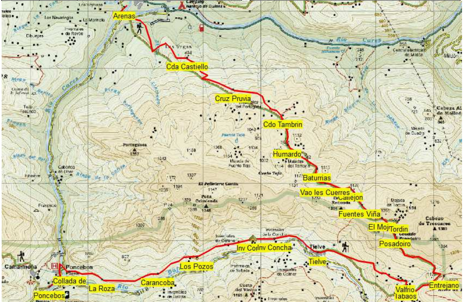
Itinerario marcado sobre un recorte del Mapa del P. N. de Picos de Europa de escala 1:40.000 de Ed. Alpina