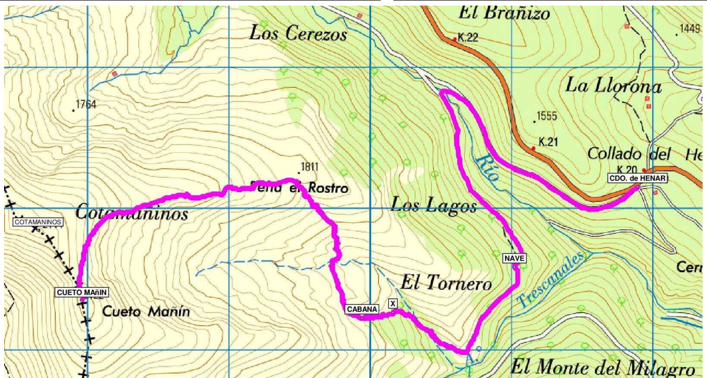
Itinerario marcado sobre un recorte del mapa 1:50.000 del I.G.N.