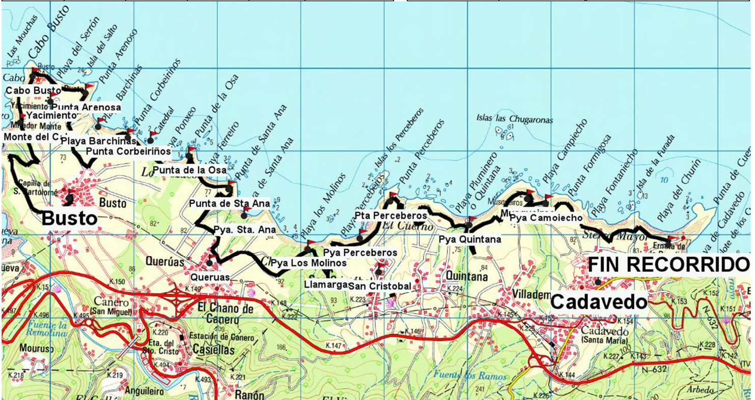
Itinerario marcado sobre un recorte del mapa 1:50.000 del I.G.N.