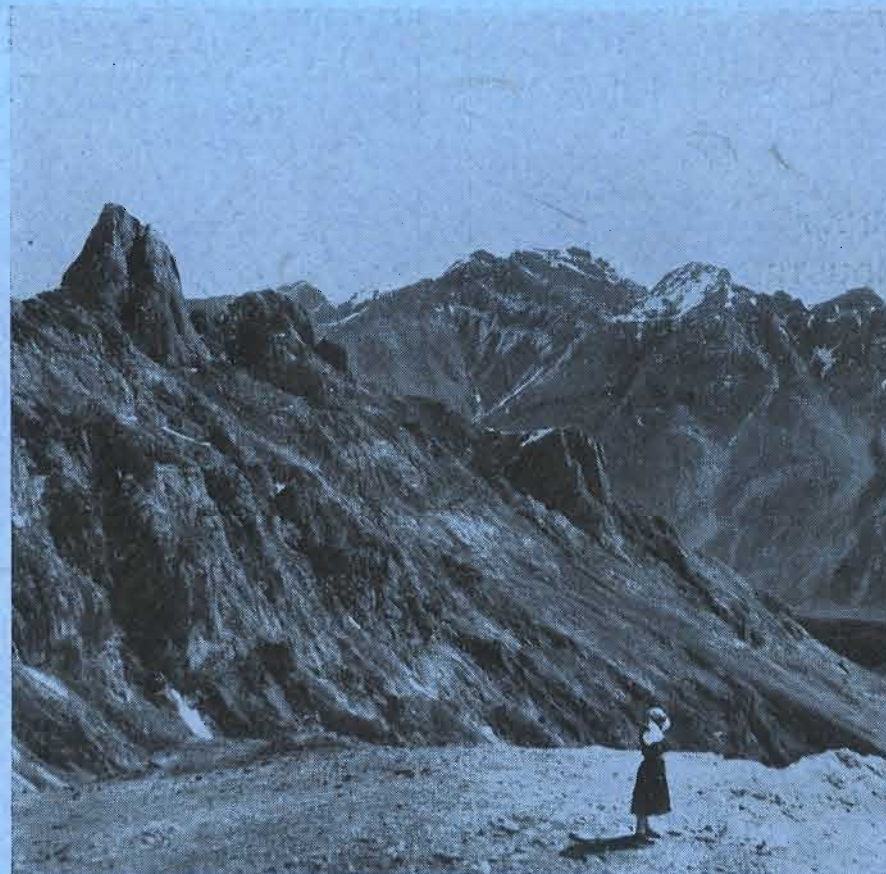
Un pañuelo en los Tiros del Rey